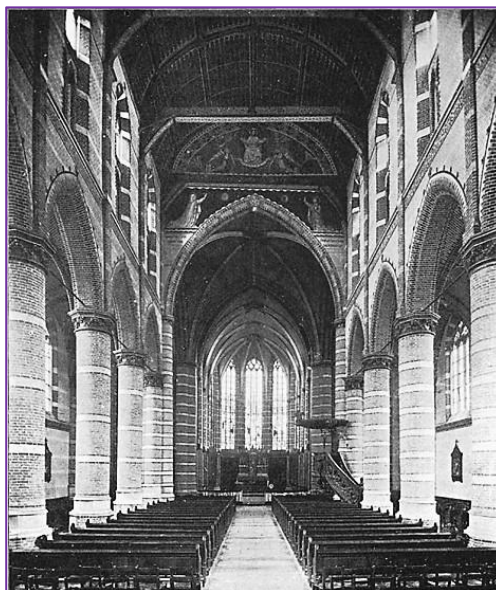
Exterieur en interieur van de kerk na de grote restauratie.