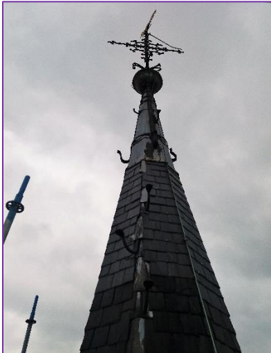
Het begin van de werken: de steiger bereikt de spits.