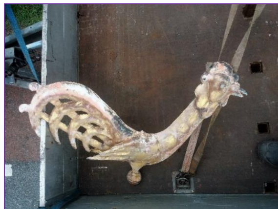
Torensaan en torenkruis naar de werkplaats om straks een pracht bekroning van de toren te vormen.