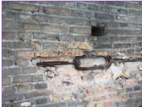
Vervangen van de muurankers