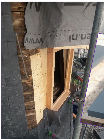
Nieuwe dakkapellen op de torenspits