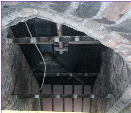
Nieuwe galimplanken in de galmgaten.