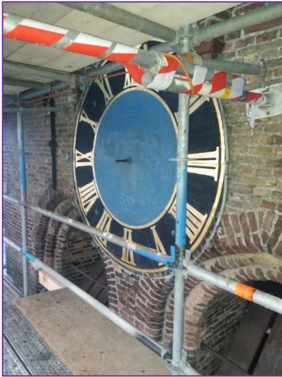
Wijzerplaat wacht weer op wijzers.