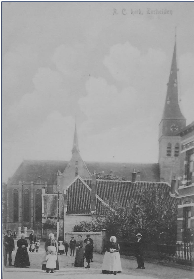
Zicht op de H. Antonius Abtkerk, helemaal linksonder een deel van het hekwerk rond de kerk en de Protestantse Poort. Het maken van een foto trok toen altijd veel bekijks.