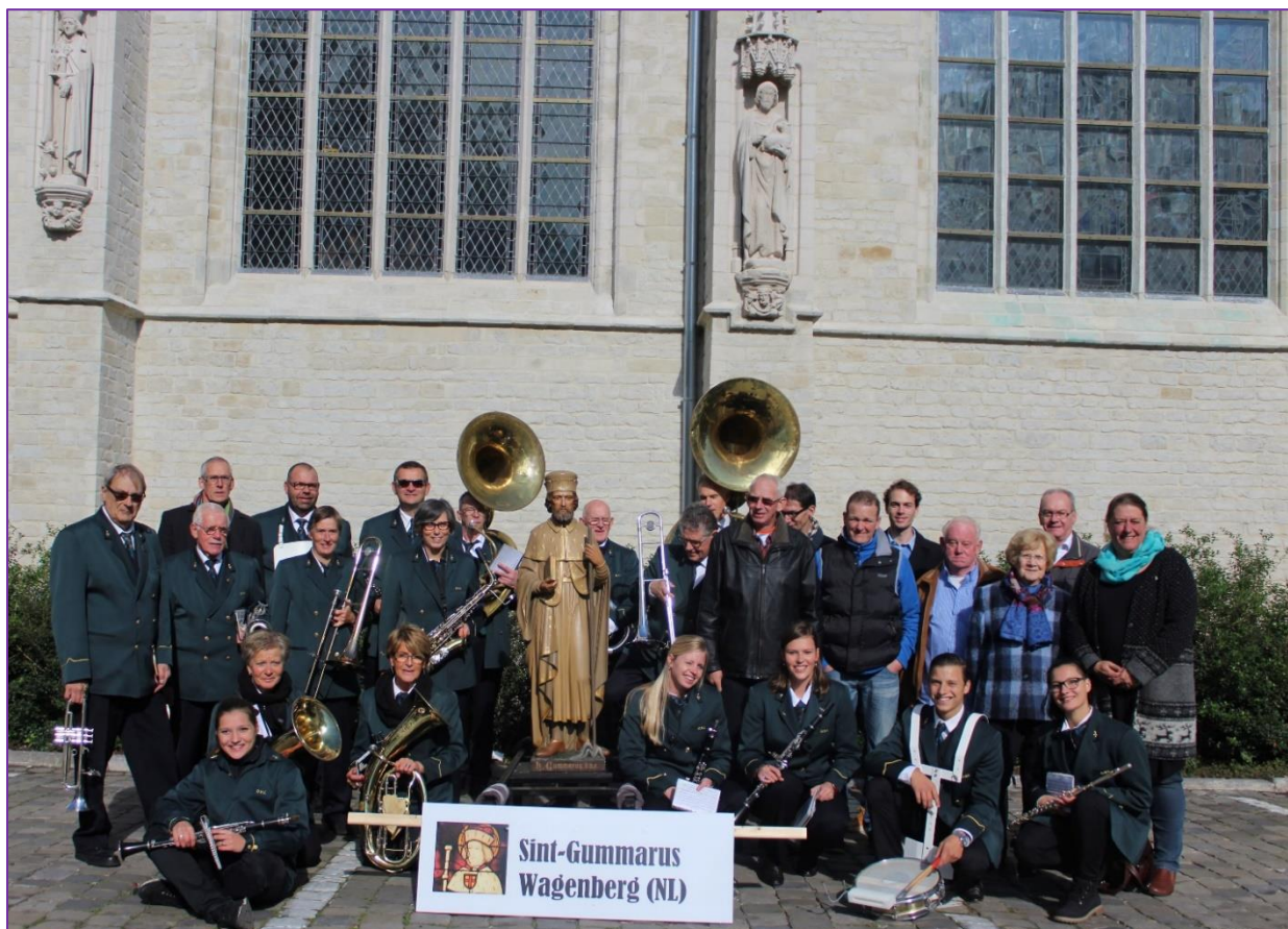
Een deel van de delegatie van onze Vijf Heiligen Parochie tijdens de processie van 2015 in Lier.